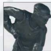
14. Schwarz patiniert